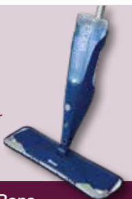
Bona Spray Mop Set