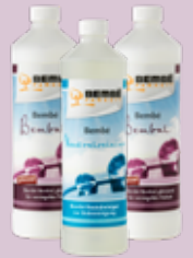
Bembal-Set Bembal 2L & Neutralreiniger 1L