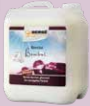
Bembé Bembal 5L für versiegelte Böden