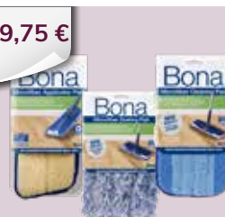
verschiedene BONA Reinigungs- & Wischtücher