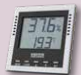
Venta Digital Thermo-Hygrometer