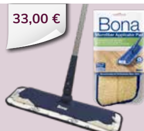
Auftrager-Set Pflegewischer mit Microfaser- tuch + Auftrager Pad