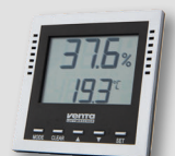
Venta Digital Thermo-Hygrometer