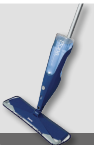
Bona Spray Mop Set