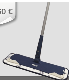
BONA Reinigungs- Pfleger inkl. Wischtuch