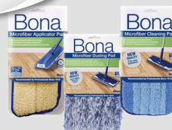
verschiedene BONA Reinigungs- & Wischtücher